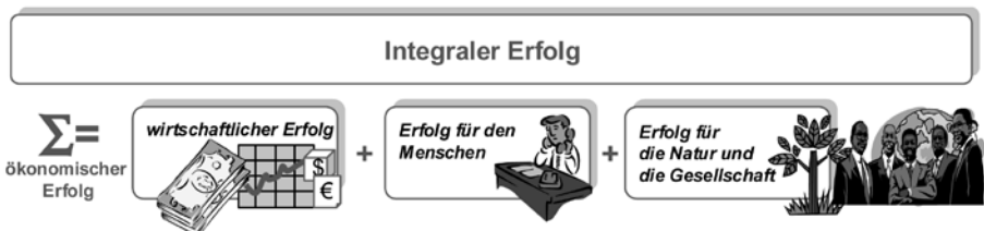
Abb. 1: Integraler Erfolg

Schließlich zeigt sich in den Fakten: Wirtschaftlicher Erfolg ist nicht unbedingt ökonomisch. Und: Rein auf wirtschaftlichen Erfolg fixierte Unternehmen sind viel zu bescheiden. Wir können weit mehr. Die hier vorgestellten Unternehmen sind Zeugen für Integralen Erfolg, welcher wirtschaftlichen Erfolg, Erfolg für den Menschen und Erfolg für die Natur und die Gesellschaft umfasst.